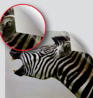
PVC-Folie: Sie dekorieren gern um? Dann drucken Sie Ihre Bilder auf Selbstklebefolie. Die lässt sich überall beliebig oft anbringen.

Neben klassischen Wandbildern haben die Hersteller weitere Materialien im Angebot, auf die Sie Ihre Lieblingsfotos drucken lassen können.