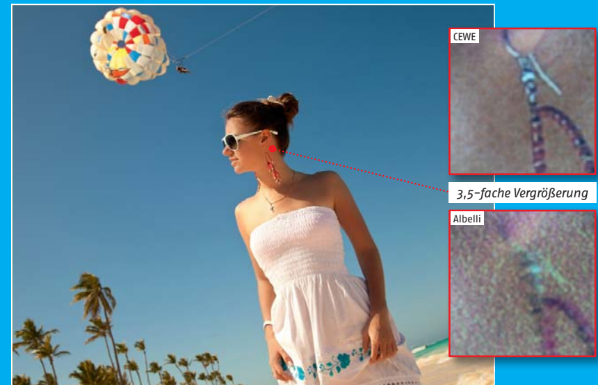
Der feine Unterschied: Der Blick durch die Lupe offenbart deutliche Abweichungen in der Schärfelistung beim Fotodruck auf Leinwand. Bei CEWE sind die Details des Ohr-rings noch gut zu erkennen, dagegen wirkt derselbe Ausschnitt bei Albelli wie Pixelbrei.

Neben der Materialgüte spielt auch die Verarbeitung eine große Rolle. Hier achten wir besonders darauf, wie robust die verschiedenen Materialien jeweils sind. Bei der Leinwand geben beispielsweise die Ecken Aufschluss darüber, wie empfindlich das Material tatsächlich ist. Zudem überprüfen wir auch, wie sorgfältig das Produkt verarbeitet wurde. Wichtige Fragen sind hier: Ist das Motiv ohne zu viel Überschuss exakt auf der Leinwand platziert? Sind die Ränder beim Alu-Dibond sauber geschnitten oder zu scharfkantig? Wurde das Fotopapier akkurat auf das Acrylglas aufgebracht oder sind Luftblasen entstanden bzw. stehen Papierreste über den Objektrand?