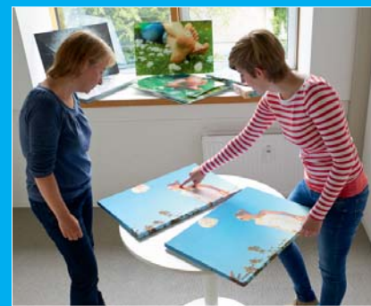
Im Test: 18 verschiedene Wandbilder wurden in einem ausführlichen Testverfahren einzeln begutachtet und bewertet.

Was „Service“ angeht, haben wir nicht nur die Angebotsvielfalt, die Funktionalität und Ergonomie des Bestellvorgangs sowie Zahlungsoptionen unter die