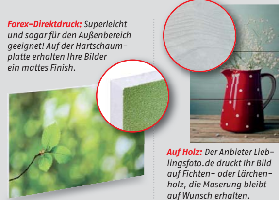
Auf Holz: Der Anbieter Lieblingsfoto.de druckt Ihr Bild auf Fichten- oder Lärchenholz, die Maserung bleibt auf Wunsch erhalten.